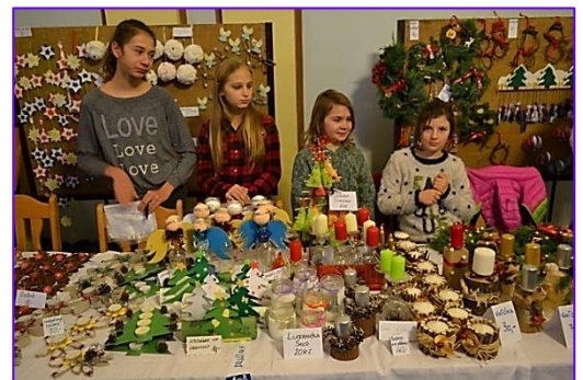
Foto z vánoční výstavy