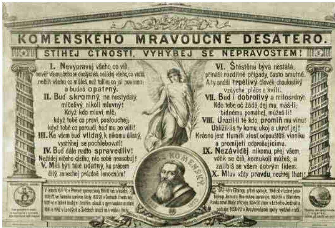
Originální didaktického obrázku je uložen ve sbírkách Národního pedagogického muzea a knihovny J. A. Komenského.

Mezi jeho nejznámější myšlenky o škole patří boj proti mechanickému vzdělávání a prosazování "školy hrou", vydávání ilustrovaných učebnic, zpřístupnění vzdělání i dívkám, názornosti ve výuce, zákazu trestů za neznalosti apod.