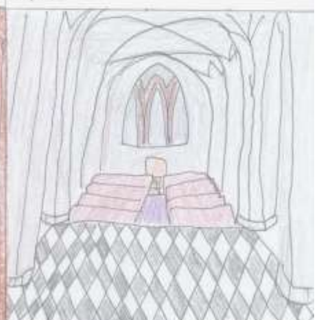
Byl pohřben v chrámu Ježíše Nazaretského v Mexiku. Bohužel se jeho kostra v roce 1823 ztratila.