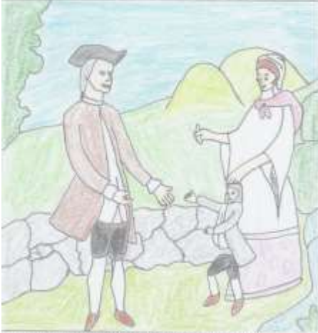
Hernán neboli Fernando Cortés se narodil v roce 1485 ve Španělsku.