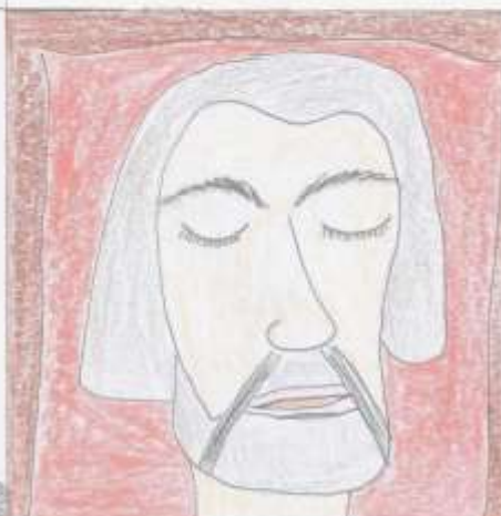
Cortés zemřel 2. prosince 1547.