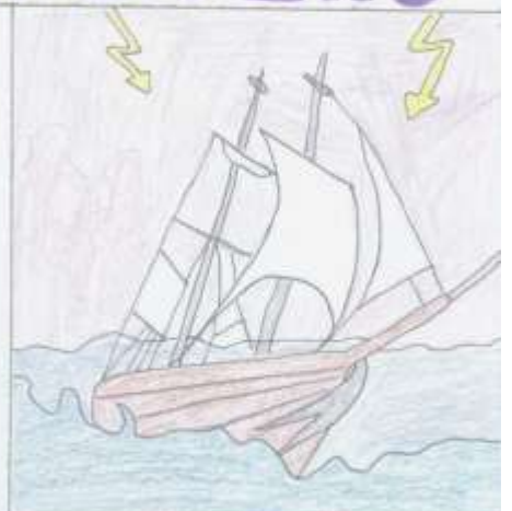
H. Cortés byl jedním z nejslavnějších španělských kolonizátorů Ameriky a v roce 1516 se vylodil poblíž dnešního města Veracruz.