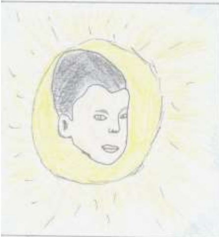
Lidé z Veracruz ho považovali za výna boha Slunce.