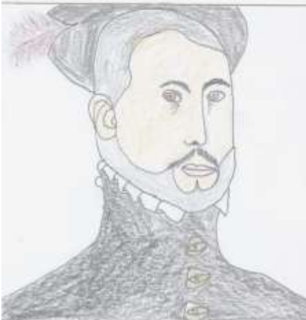
V roce 1541 se účastnil válečné výpravy do Alžírsko.