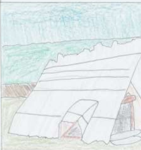
Císař Mexicana II. Cortézovi nepovolil vstup do města Tlaxcala. Kvůli tomu Cortés založil osadu Villa Rica de la Vera Cruz.