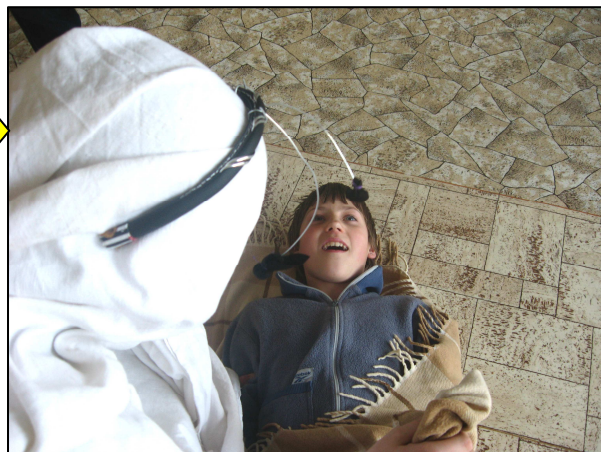
8. Tento jedinec se hodí pro další studium.