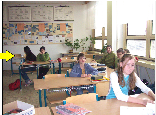
2. Nic netušící žáci se vzdělávají.