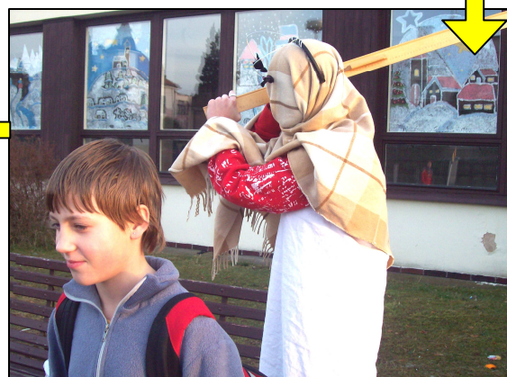
5. Únos se zdařil.