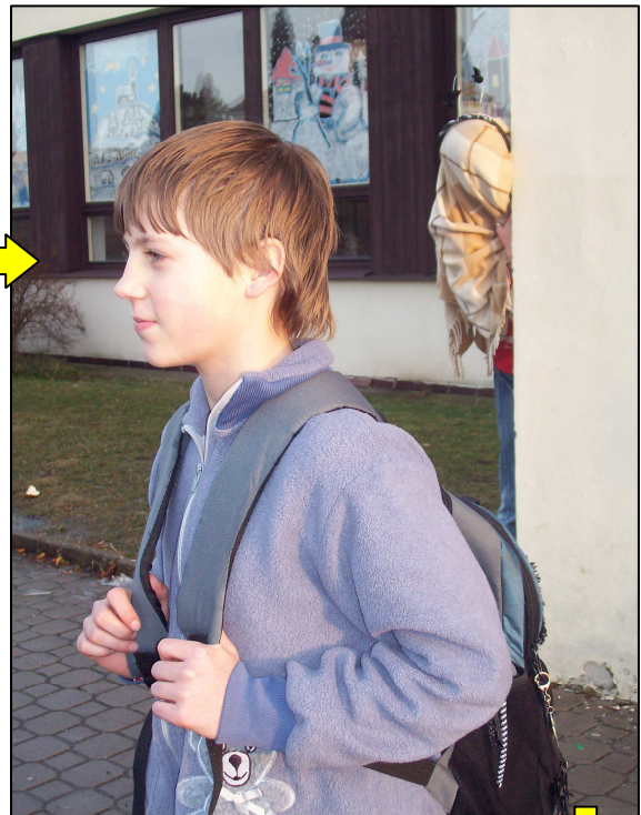
4. Již mají vybráno a svou oběť sledují