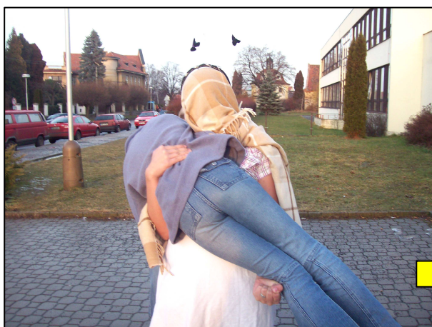
11. Mimozemšťané jsou stále ve střehu a svou oběť opět lapí.