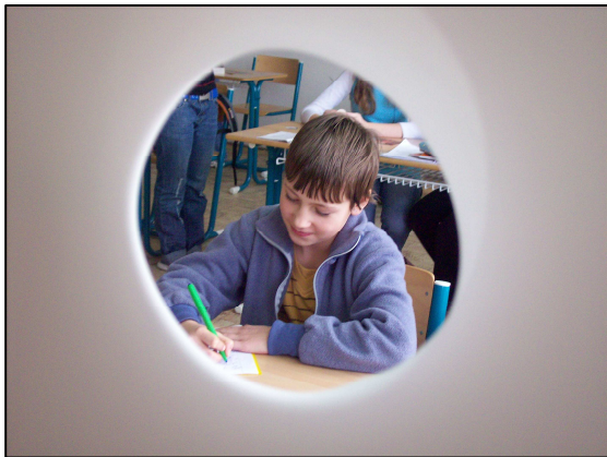
3. Mimozemšťané zaměřují svou oběť.