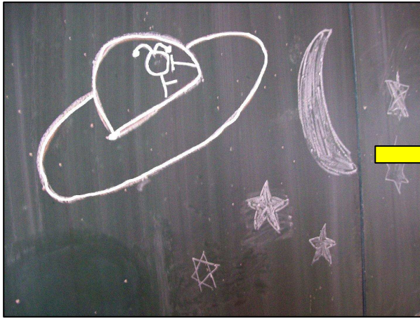
1. Tmavá noc, mimozemšťané obhlíží naši planetu.